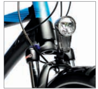
Das Top-Licht von Trelock fällt durch seine Lichtleiter auf.