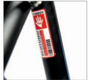
Der Sicherheits-Code gehört bei Kreidler zum Standard.